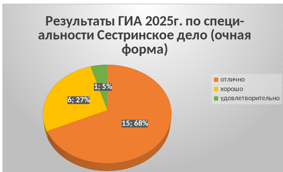
Рис.2 – Характеристика выпуска 2025 года